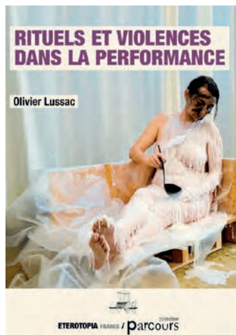
Olivier Lussac Rituels et violences dans la performance Eterotopia, 216 p., 19 euros