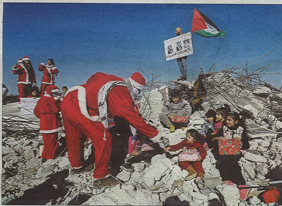
NAVIDADES EN EL BELÉN OCUPADO. Miles de peregrinos llegan cada año hasta Belén, la localidad palestina en la que, según la tradición, nació Jesús. Pero el pueblo saca poco provecho del turismo, que en su mayoría pasa unas pocas horas y pernocta en Israel. En la foto, activistas ataviados de Papá Noel reparten regalos a familias locales entre las ruinas de casas demolidas. PÁGINA 8

mento rechazó las exigencias —económicas, técnicas y operativas— de esta compañía, que habrían obligado a revisar el pliego. Fracasada esta vía, el contrato saldrá a concurso público, en el que podrán competir empresas españolas y extranjeras. PÁGINA 20